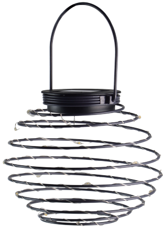
Solar-Gartenleuchte Solar Garden Light 613-400761

Manufacturer: EXPO-Börse GmbH Industriestr. 12 D-49577 Ankum www.expo-boerse.de