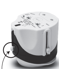
Slide knob in top position