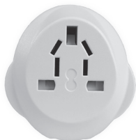
Socket of Universal Travel Adaptor